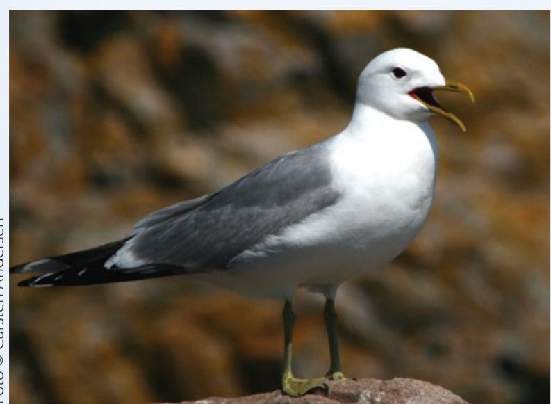
Stormmåge Common Gull Larus canus