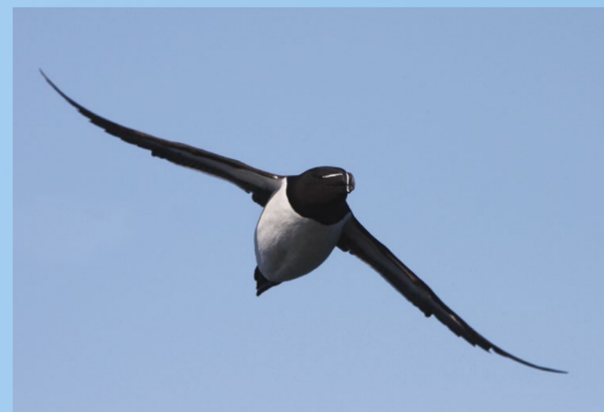
Alk Razor Bill Alca torda