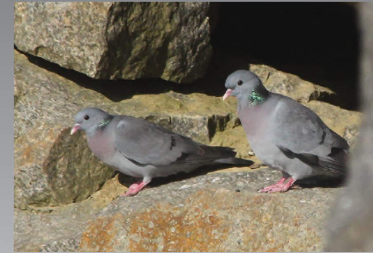
Hulduer Stock Dove Columba oenas