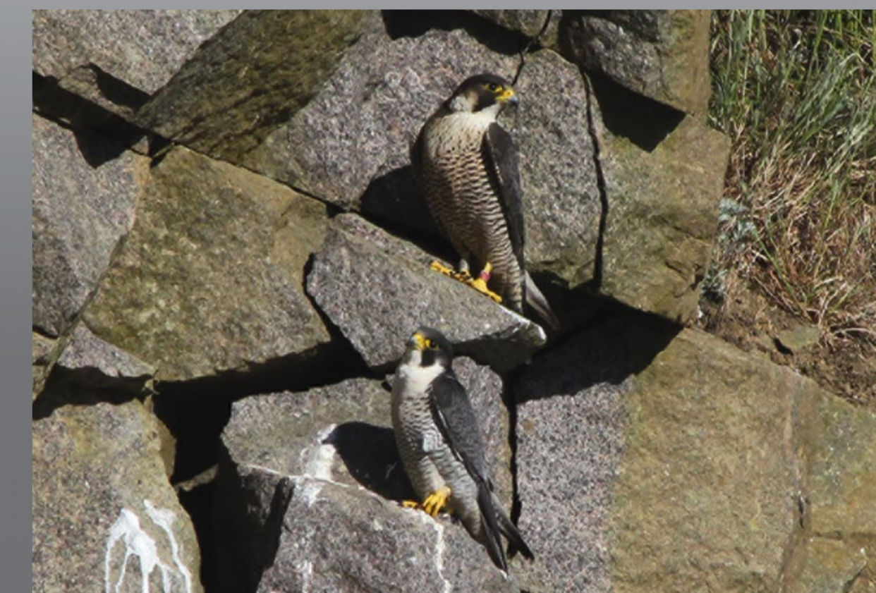
Vandrefalkeparrets yngleplads er godt beskyttet på de stejle klippesider.

The European Union has designated the Peregrine Falcon one of our most endangered bird species, and their breeding grounds must be protected in the best possible way.