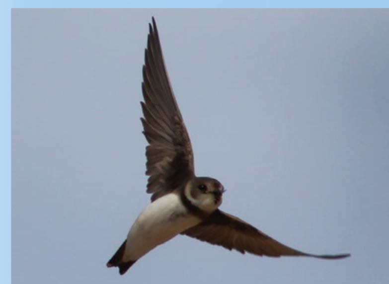
Digesvale Sand-Martin Riparia riparia