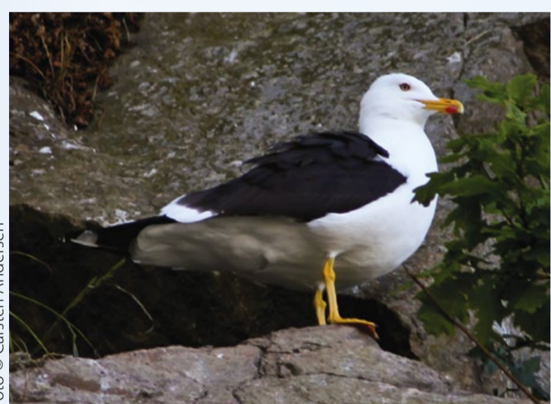
Sildemåge Lesser Black-backed Gull Larus fuscus