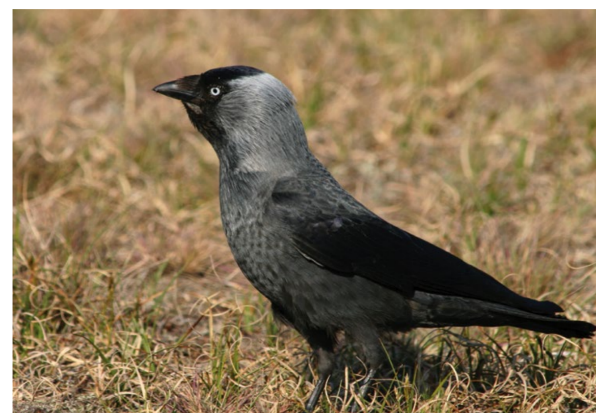
Allike Jackdaw Corvus monedula

Jackdaws and Stock Doves breed in the escarpment crevices. The Stock Dove is slightly smaller than the more common Wood Pigeon and does not have the Wood Pigeon's white markings on its neck or wings.