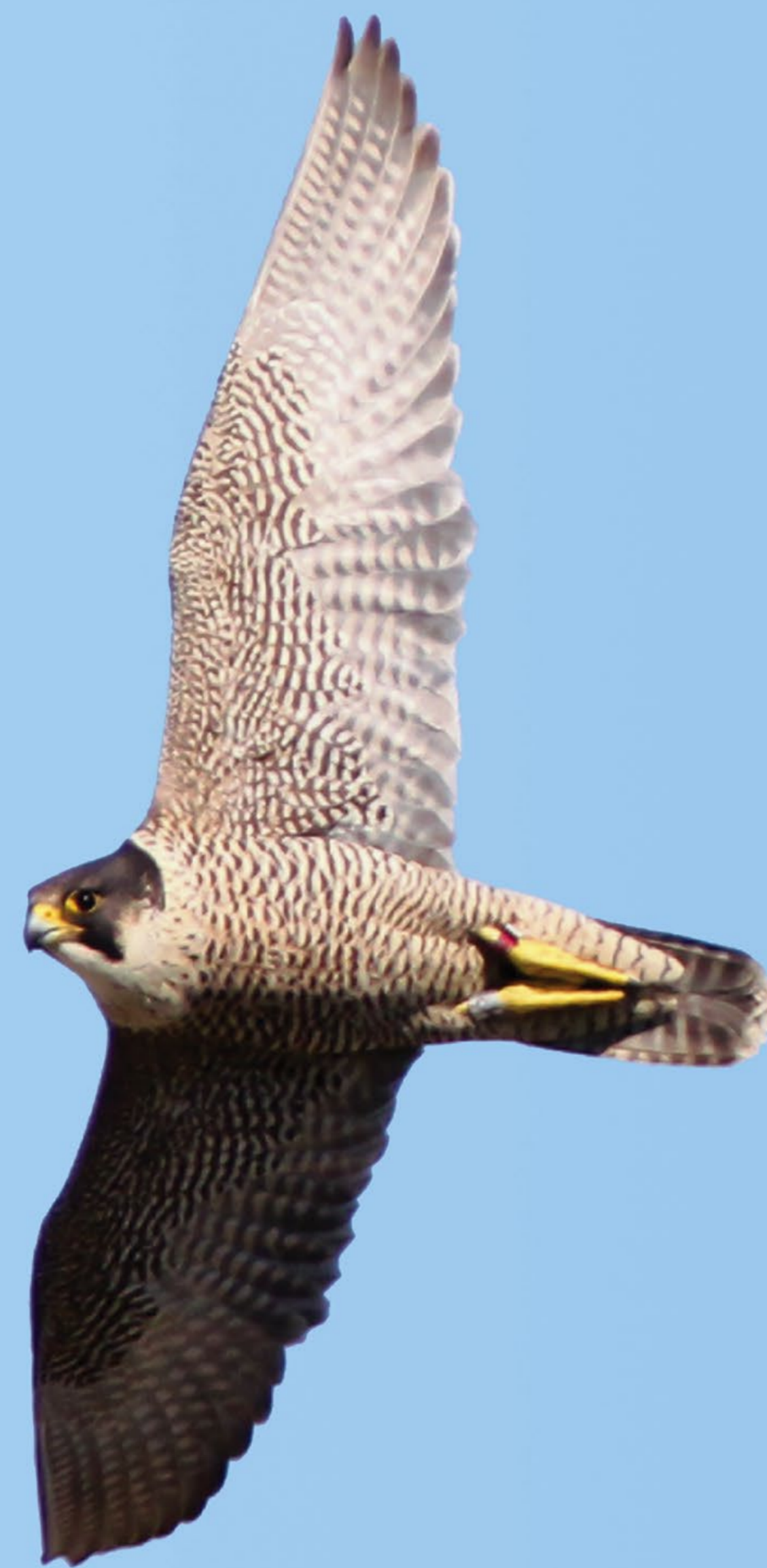
Vandrefalk, hun. Peregrine Falcon, female. Falco peregrinus .

A few pairs of Little Ringed Plovers breed in the quarries. Their habitats are the relatively moist, flat areas on the floor of the quarries.