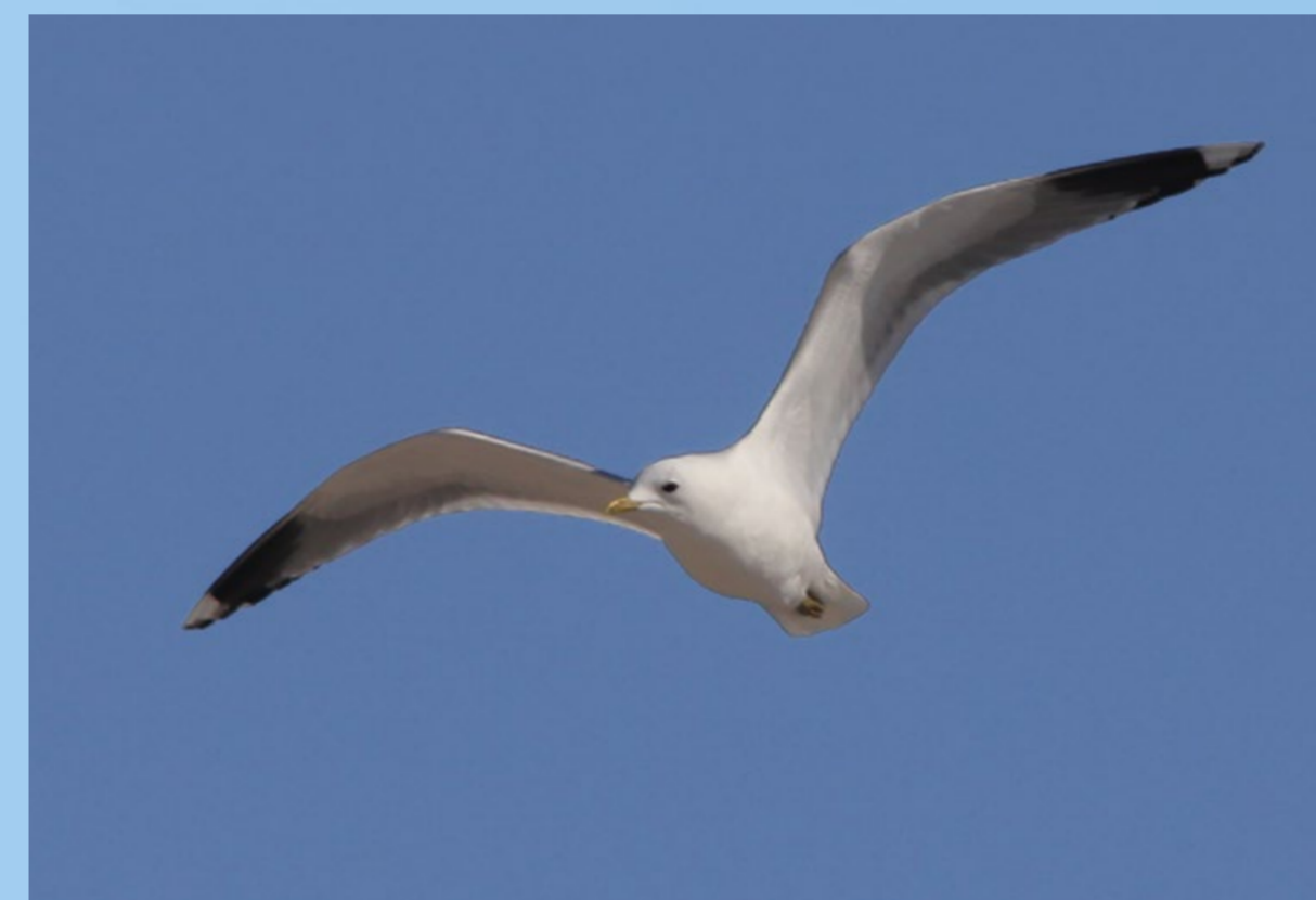
Stormmåge Common Gull Larus canus