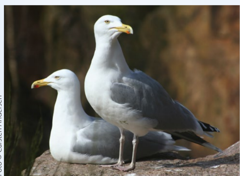
Solvmåge Herring Gull Larus argentatus