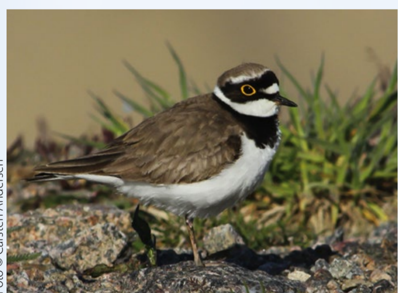
Lille præstekrave Little Ringed Plover Charadrius dubius