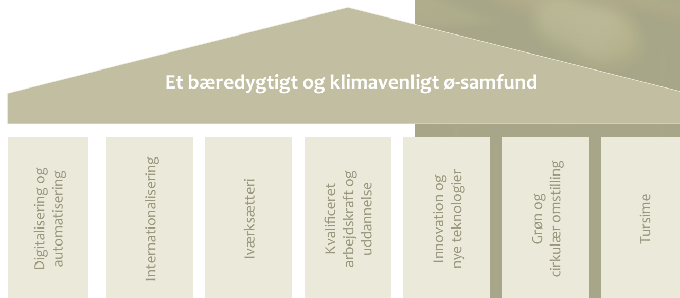
Figur 1 Emner i det regionale kapitel i Erhvervsfremme i Danmark 2020-2023

Bornholm har sit eget kapitel i den nationale erhvervsstrategi Erhvervsfremme i Danmark 2020-2023 , hvor rammen for øens strategiske retning er defineret som i figuren nedenfor. Det regionale kapitel for Bornholm er formuleret i samarbejde og dialog med erhvervshusbestyrelsen på Bornholm, hvis medlemmer er udpeget af Bornholms Regionskommune.