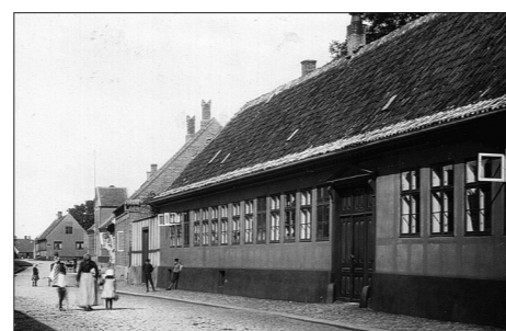
Overkalket bindingsværk på Amtsgården, Storegade i Rønne