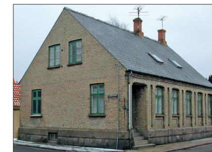
Grundmuret hus med skifertag i Nexø