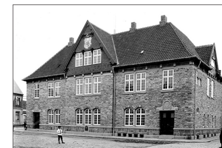
Rønne posthus af Mathias Bidstrup