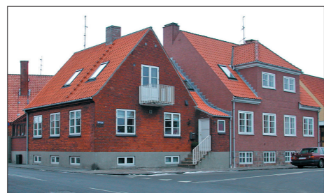
Bombehuse, Nørregade i Nexø