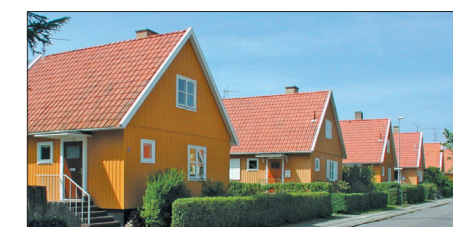
Svenskehuse, Lærkevej i Rønne