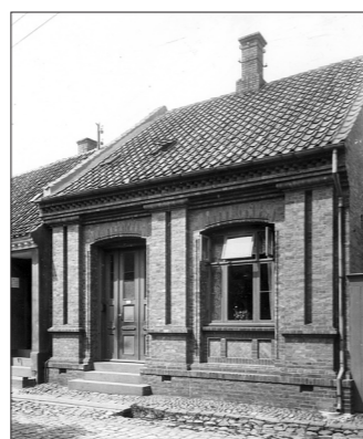
Grundmuret hus i "blank mur", Borgergade i Rønne