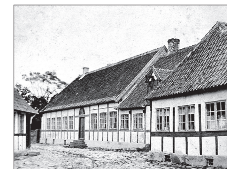
Købmagergade i Nexø, 1800-tallet

1800-tallets bindingsværk varenklere og mere regulært. Mangel på egetømmer, samt brug af mursten til tavl, betød at fodtømmeret blev undladt og gavlnægtene forsvandt. Fra de første årtier blev mange trægavle og stråtage i købstæderne udskiftet med mursten og tegltagsten, som følge af indførte krav efter de mange bybrande. Byhusene ændrede derved karakter med lidt mere pynt, og skilte sig ud fra boligerne på landet og i fiskerlejerne, hvor