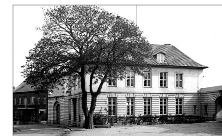
Sparekassen i Allinge af O. Funch-Espersen