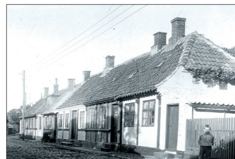
Små 1800-tals huse i Møllegade i Rønne

Meget murværk stod kalket, men fra midten af 1800-tallet vandt "blank mur" mere og mere frem – dels fordi det var datidens stil og byggeskik, dels fordi murerhåndværket var blevet bedre udviklet. Med blank mur er det murstenenes egen overflade og fugningen, måske med en fremstående profil, der danner den færdige facade. Der blev også arbejdet med relief i murfladen, som udkragninger, bånd (fremstående kanter) og blændinger under vinduer. Ofte brugte man specielt formede sten til kanter eller i kombinationer i f.eks. gesimser. Det krævede formsans, lidt arkitekturviden og et godt håndværksarbejde hos de lokale muremestre. I de sidste par årtier i 1800-tallet og et par ind i 1900-tallet – med den stigende industrialisering – blev murerhåndværket meget udviklet,