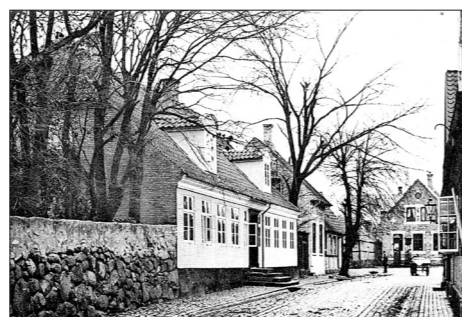
Præstegården opført i 1831, Provstegade i Rønne