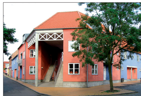
Nye boliger i Rønne Tegnestuen 'Blå Streg'