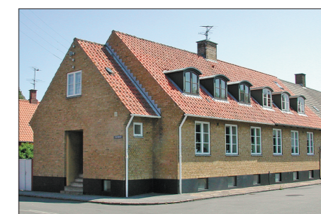
Bombehuse, Købmagergade i Nexø