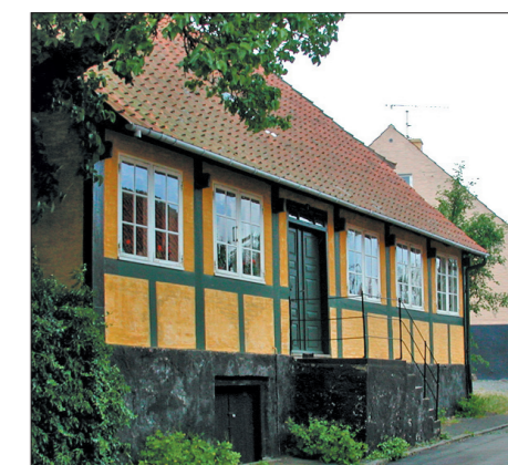
1800-tals bindingsværkshus i Svaneke